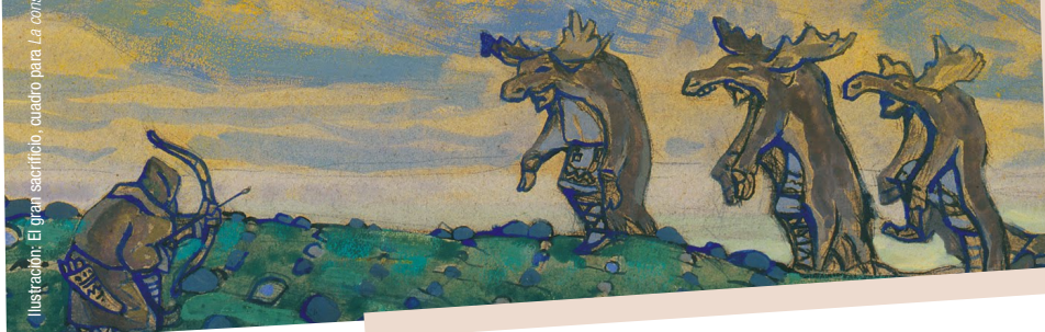
Ilustración: El gran sacrificio, cuadro para La consagración de la primavera (Nicolás Roerich)