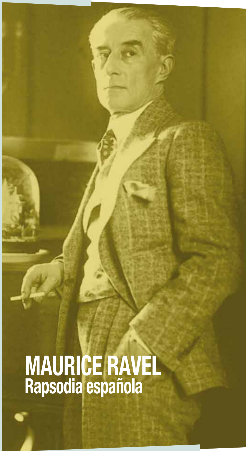
MAURICE RAVEL Rapsodia española